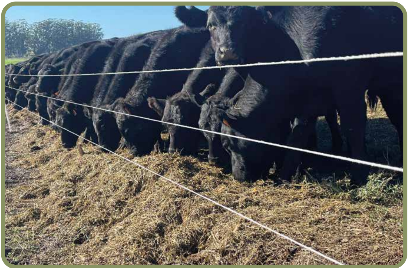
Figura 2. Terneros consumiendo la dieta ofrecida bajo el eléctrico durante acostumbramiento.