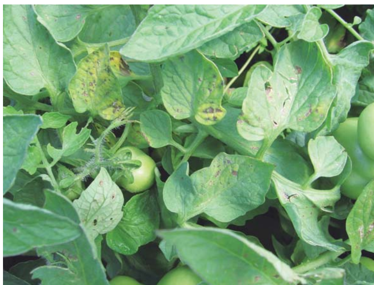
Figura 28. Síntomas de mancha gris en follaje.

Ataca solamente hojas (comienza por las jóvenes) en las que aparecen manchas marrones pequeñas (3 mm) y alargadas, angulares en forma de estrella que se rajan al centro y se rodean de un halo amarillo (Figura 28). Cuando la hoja tiene muchas lesiones la misma se amarillea y se seca. No afecta tallos ni frutos.