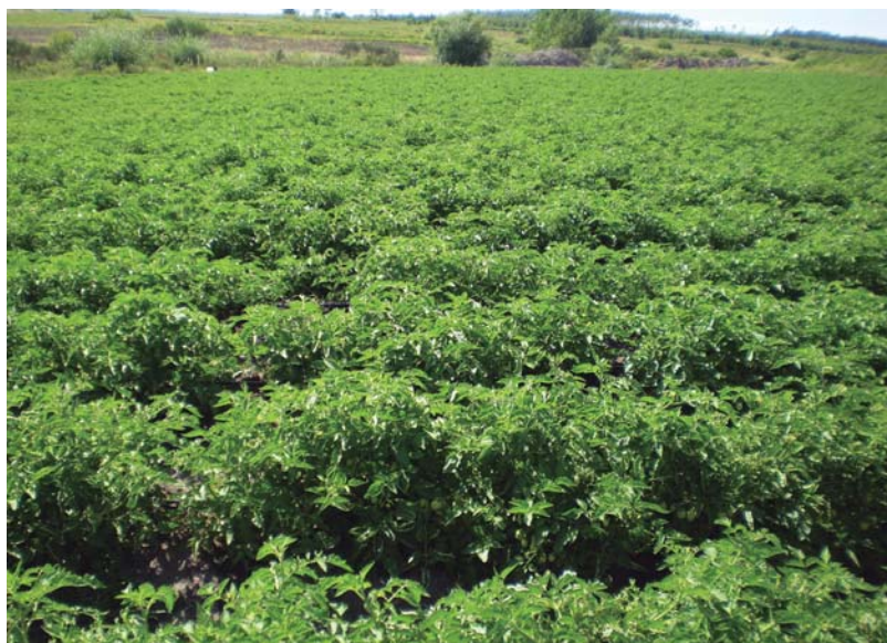
Figura 4. Cultivo de tomate para industria cultivar Loica.

El tomate para industria en la zona sur involucra anualmente aproximadamente a unos 300 productores y ocupa 300 a 400 hectáreas. Los rendimientos son variables según la temporada, zonas y productores, oscilando entre 40 y 80 toneladas por hectárea (Figura 4).