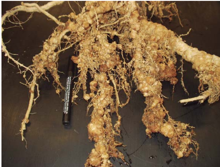
Figura 38. Raíces de tomate con presencia de nódulos.