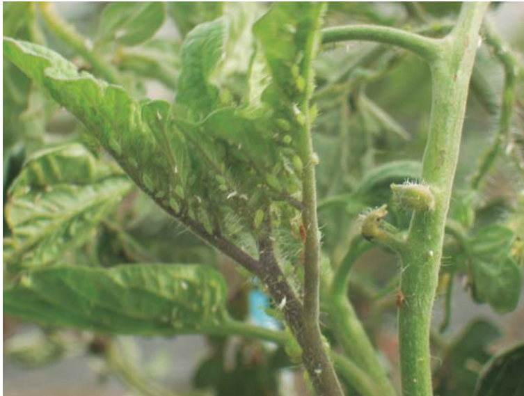
Figura 20. Colonia de pulgones sobre brote de tomate.

Forman colonias que se observan con facilidad sobre hojas y brotes nuevos (Figura 20).