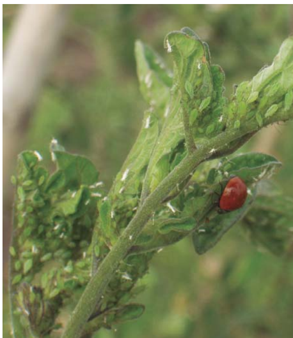
Figura 21. Colonia de pulgones y presencia de depredadores (coccinélidos).

Registrar si los pulgones están parasitados y la presencia de insectos depredadores (Figura 21).