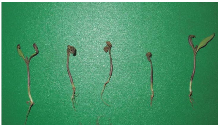
Figura 25. Adelgazamiento de cuello y degradación de raíces producido por mal de almácigos en tomate