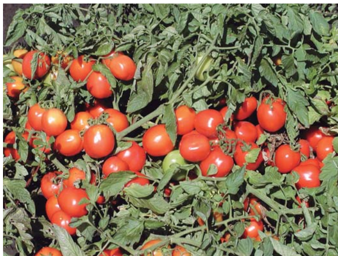
Figura 2. Frutos maduros de tomate para industria.

Es un alimento con escasa cantidad de calorías y la mayor parte de su peso es agua. Contiene azúcares simples que le confieren un ligero sabor dulce y algunos ácidos orgánicos que le dan el sabor ácido característico. Es una fuente importante de vitaminas como la vitamina C y de minerales como el potasio y el magnesio.