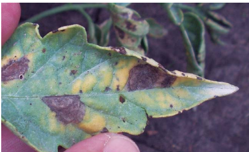
Figura 26. Síntomas de tizón temprano en hoja.

El tizón temprano puede afectar hojas, tallos, flores y frutos. En las hojas basales (más viejas) aparecen manchas marrones que se van agrandando en forma de círculos concéntricos y están rodeadas de un halo amarillo, este síntoma es muy característico de esta enfermedad (Figura 26). En el tallo se forman lesiones alargadas también marrones y con dibujos concéntricos. Las lesiones en los frutos se dan generalmente en la zona del cáliz (unión con la planta) y se cubren de un moho negro oscuro.