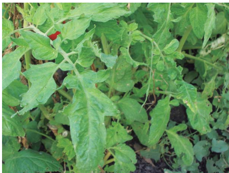
Figura 32. Deformación foliar ocasionada por CMV.

El resto de las virosis son difíciles de diagnosticar por síntomas ya que se observan mosaicos, manchas necróticas en hojas y frutos, aclarado o decoloración de nervaduras y crecimiento anormal.