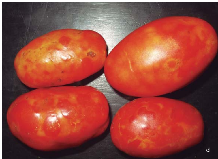
Figura 31. Diversos síntomas de peste negra en tomate (cultivares sensibles). d. Anillos en frutos.

Si la planta llega a producir frutos, éstos son de tamaño reducido, con círculos o anillos en relieve (Figura 31 d).