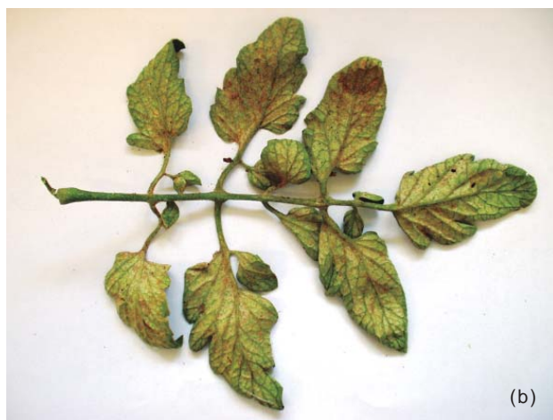
Figura 23. Daño de arañuela ( T.urticae ) sobre hoja de tomate (haz (a) y envés (b)).