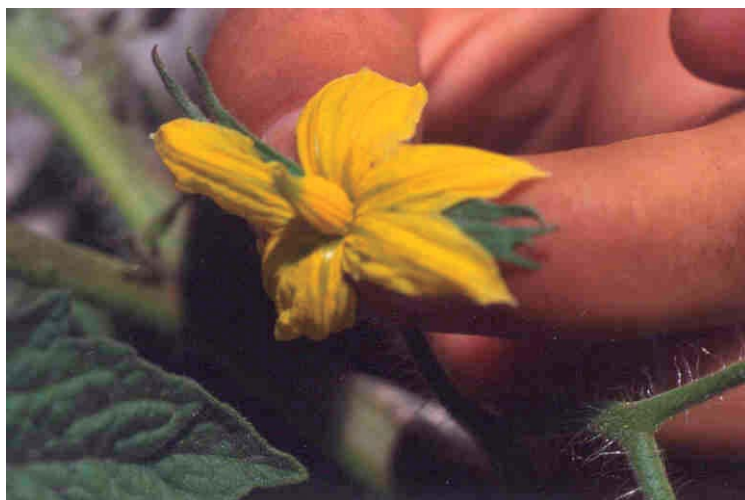
Figura 16. Observación de trips sobre la flor de tomate.