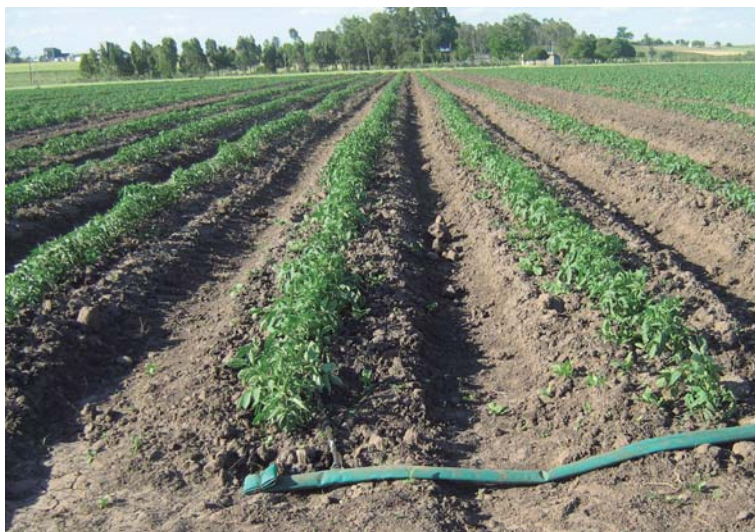
Figura 7. Plantación de tomate para industria sobre canteros.

Los caballotes tienen que estar colmados/aporcados definitivamente previo a la plena floración del cultivo.