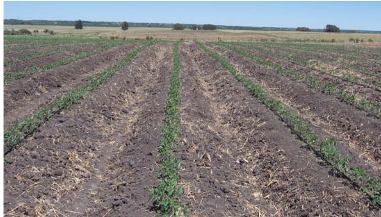
Figura 5. Cultivo de tomate trasplantado sobre suelo con abono incorporado.

Se recomienda la instalación de abonos verdes de invierno previo al cultivo, como ser avenas o trigos, incorporándolos al suelo con disquera, con anticipación suficiente para lograr su descomposición (Figura 5). Como fertilización de base previo a la siembra del abono verde se recomienda el agregado de estiércol que haya sido fermentado durante un período mínimo de seis meses.