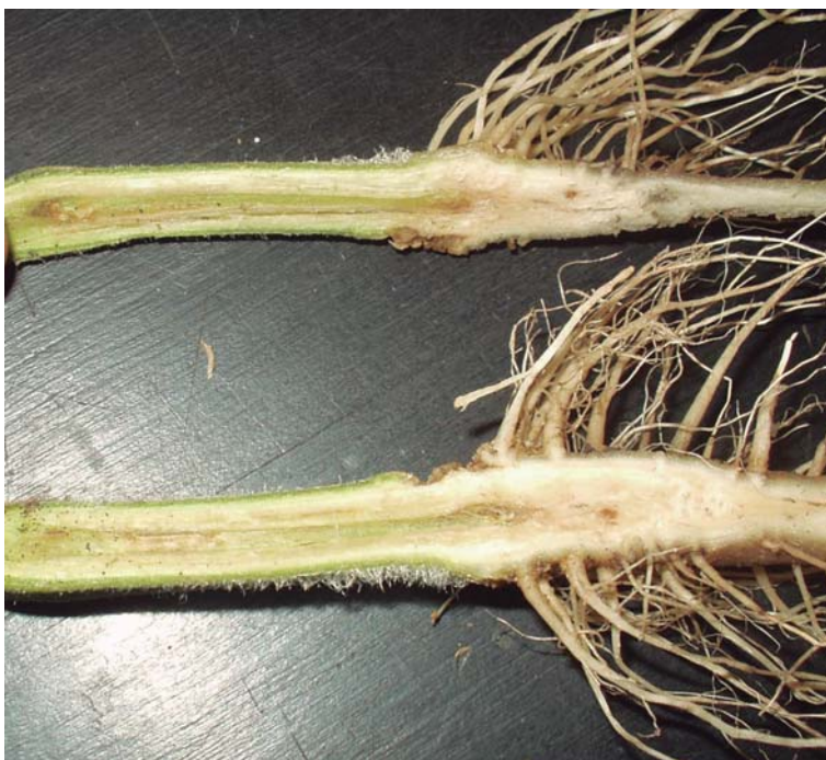
Figura 30. Síntoma de fusarium en tallo.

Las hojas basales de las plantas afectadas amarillean y se secan, a veces sólo las de un sector de la planta. Al comienzo las plantas se marchitan solamente en las horas más calurosas del día pero finalmente el marchitamiento les provoca la muerte. Cuando el marchitamiento es causado por Verticillium se observa un secado del ápice de la hoja en forma de V invertida. En ambos casos las hojas secas permanecen adheridas a la planta y al cortar el tallo se ve el sistema vascular amarronado (Figura 30).