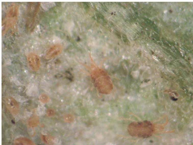
Figura 22. Arañuelas ( T.urticae ) sobre hoja de tomate.