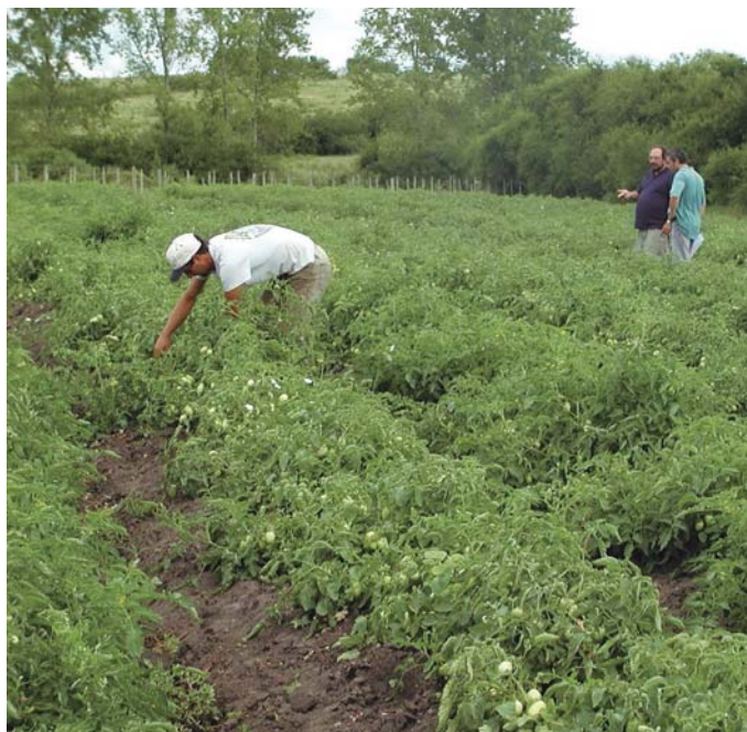
Figura 9. Monitoreo de plagas y enfermedades en el cultivo.

Se debe consultar al técnico asesor para seleccionar los plaguicidas a utilizar en función de los problemas sanitarios que se detecten en el monitoreo semanal.