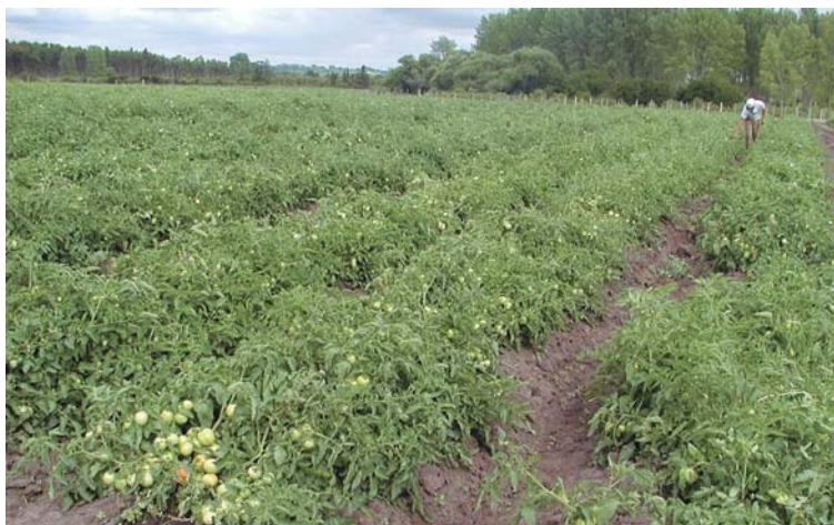
Figura 14. Monitorización del cultivo.