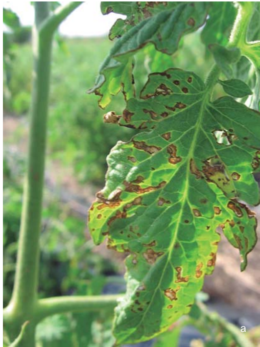
Figura 35. Síntomas de mancha bacteriana en tomate. a. Hoja y b. Fruto.