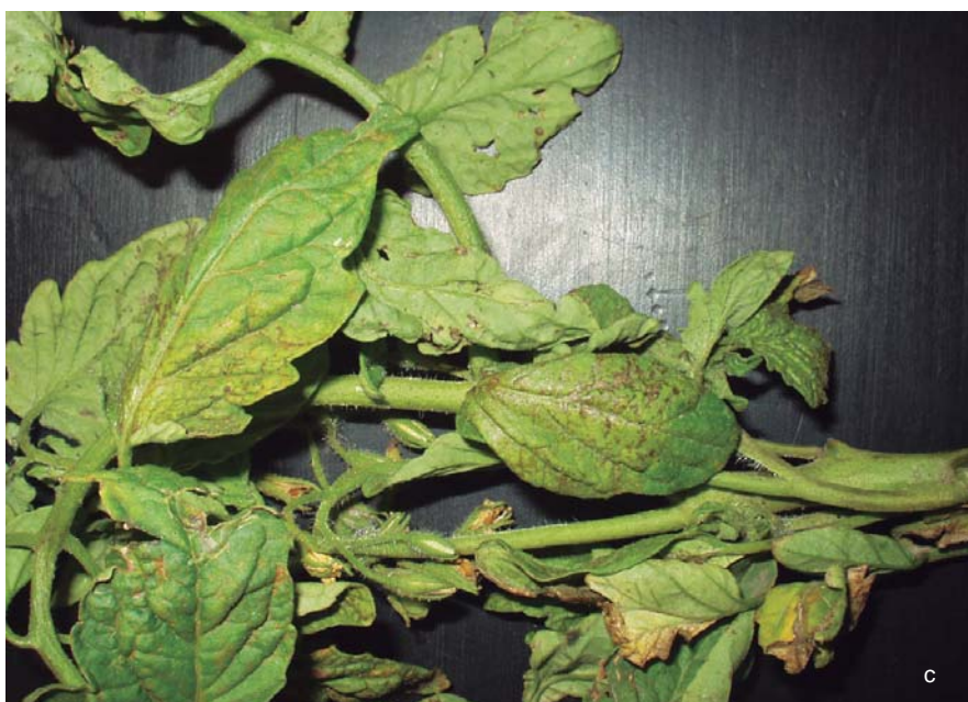
Figura 31. Diversos síntomas de peste negra en tomate (cultivares sensibles). b. Coloración violácea y muerte de ápice, c. Necrosis de tejido foliar.