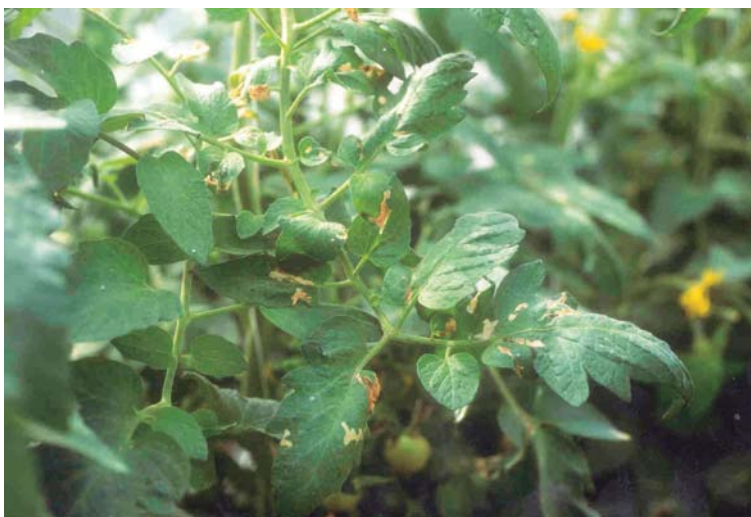
Figura 13. Daño de polilla ( T.absoluta ) sobre hojas de tomate.

Los daños se evidencian en todas las partes aéreas de la planta. Las larvas provocan el minado de las hojas, taladran los brotes y producen galerías en los frutos (Figura 13).