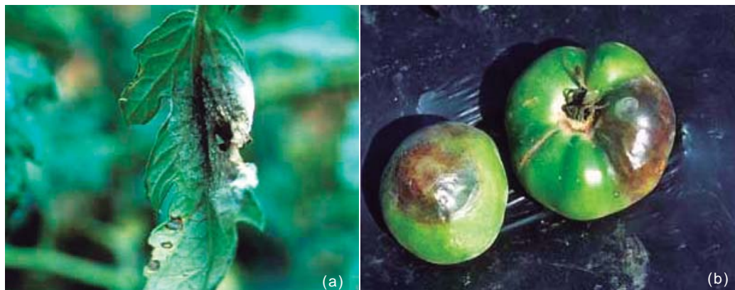
Figura 27. Síntomas de tizón tardío en hojas (a) y frutos de tomate (b).

provocan una podredumbre firme. Podredumbres similares también pueden ser provocadas por otras especies de Phytophthora pero se registran cuando las temperaturas son más elevadas.