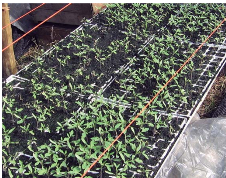
Figura 24. Síntomas de mal de almácigos en tomate.

Se pueden observar dos tipos de daños: en pre-emergencia y en pos-emergencia de las plantitas de tomate. Cuando el ataque ocurre previo a la emergencia, los almácigos se presentan desperejados, ralos, con fallas y se observa una disminución severa de la población de plantas (Figura 24). En los ataques que se producen luego de la emergencia, las plantas presentan enanismo, amarillamiento, secado de los ápices de sus hojas y se vuelcan. La zona del cuello se encuentra adelgazada y las raíces degradadas (Figura 25). El ataque se produce en focos o en manchones que luego se generalizan a todo el almácigo.