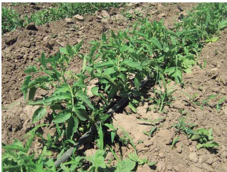
Figura 8. Riego por goteo de tomate para industria.

El tomate para industria tiene una alta respuesta al agua disponible en el suelo, necesaria para el desarrollo de la planta y los frutos. Se recomienda el uso del riego por goteo de acuerdo a la demanda del cultivo en sus etapas fisiológicas (Figura 8).