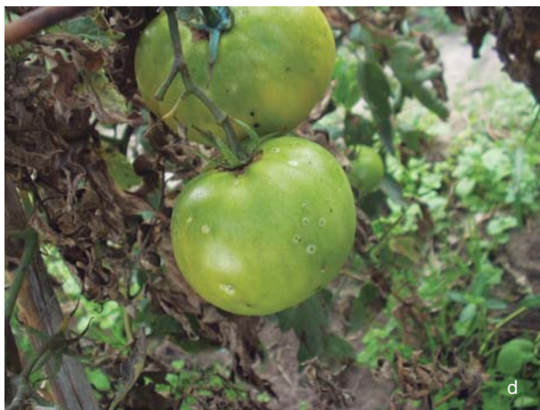
Figura 33. Síntomas de cancro bacteriano del tomate. c. Necrosis del borde de los folíolos y d. Mancha en ojo de pájaro en fruto.