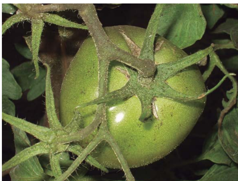
Figura 19. Presencia de fumagina sobre fruto de tomate.

Las larvas producen secreciones azucaradas que se depositan sobre las hojas y los frutos, lo que favorece la formación de fumagina (Figura 19). Como consecuencia se desmejora la calidad comercial de los frutos.