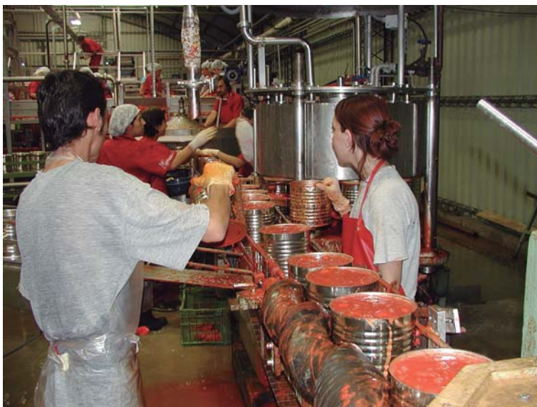
Figura 3. Línea de envasado de tomate para industria.

Existe una fuerte presencia de organizaciones de productores de primer y segundo grado (sistema cooperativo), vinculados con las industrias, que contribuyen junto a DIGEGRA e INIA en la implementación de las Normas de Producción Integrada facilitando el acceso a la capacitación y asistencia técnica de los productores involucrados.