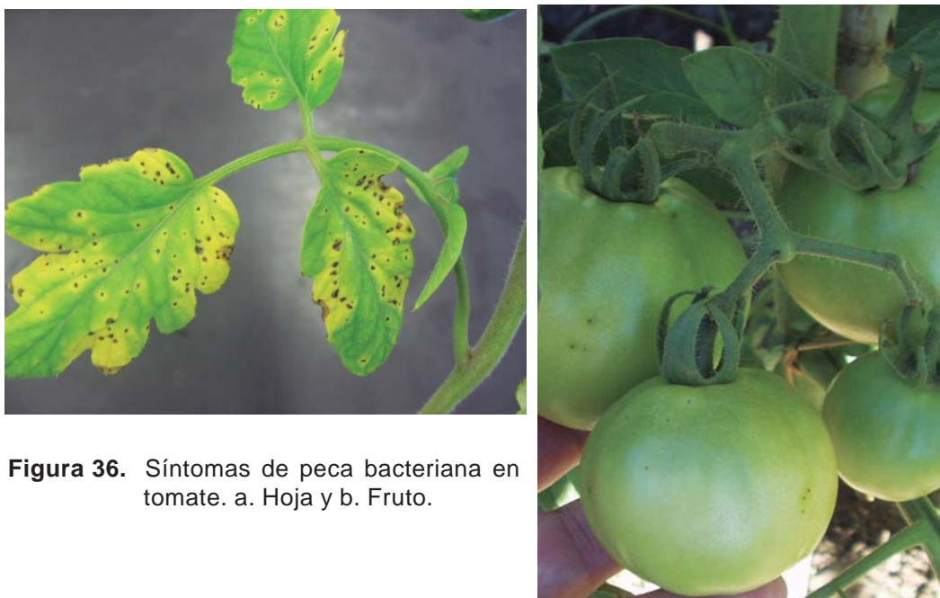
Figura 36. Síntomas de peca bacteriana en tomate. a. Hoja y b. Fruto.

Los síntomas en follaje son muy similares a los de la mancha bacteriana pero en este caso las lesiones son siempre de tamaño menor (de ahí el nombre peca) oscuras, nunca levantadas y siempre rodeadas de halo amarillo (Figura 36 a). Los síntomas en tallos, pecíolos y pedúnculos son indistinguibles de los de mancha bacteriana. En fruto las lesiones de peca son más pequeñas que las de mancha, poco levantadas y nunca rajan (Figura 36 b).