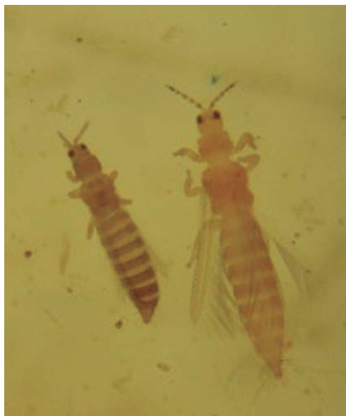
Figura 15. Adultos de trips.

La información del conteo directo se puede complementar con el uso de trampas amarillas adhesivas.