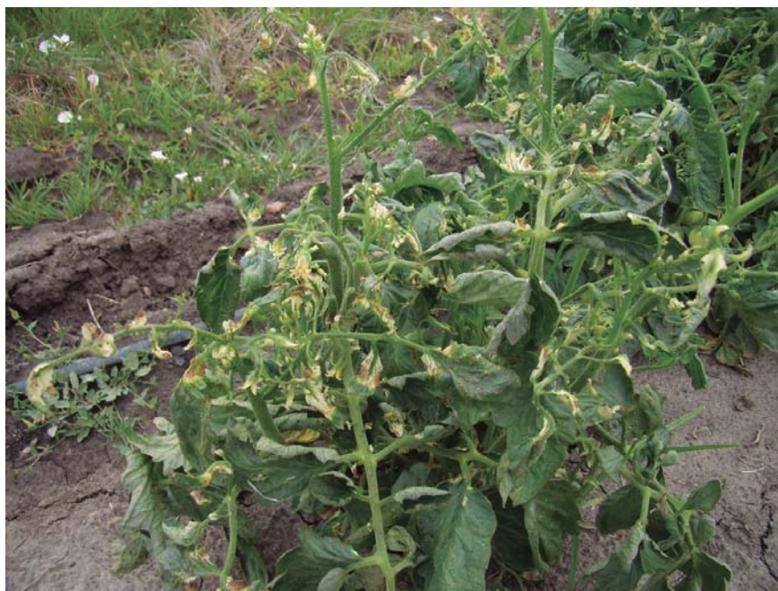
Figura 38. Daño al follaje por deriva de aplicación de glifosato.

Debe tenerse especial cuidado si se realizan aplicaciones con glifosato en las entrefilas de los canteros para el control de malezas, lo mismo si se aplica en cultivos extensivos cercanos al cultivo de tomate, ya que la deriva puede provocar daños al cultivo (Figura 38).