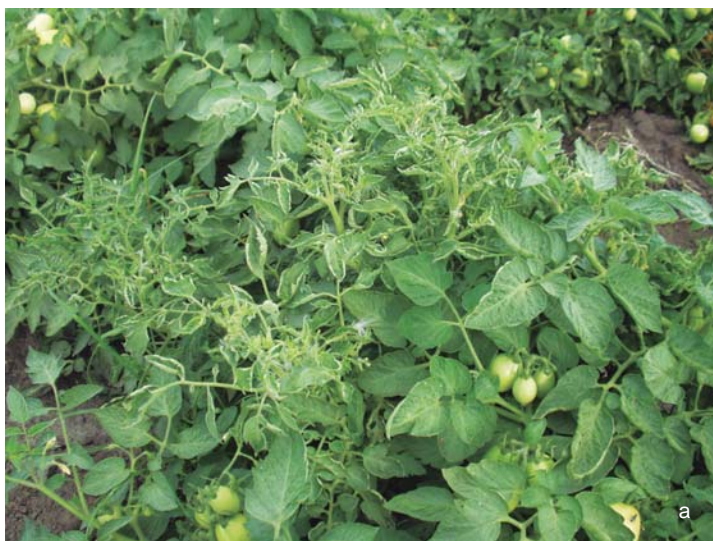
Figura 31. Diversos síntomas de peste negra en tomate (cultivares sensibles). a. Deformación foliar.

Los ataques tempranos producen enanismo, disminuyen mucho los rendimientos e incluso pueden provocar la muerte de la planta. Lo primero que se observa es la detención del crecimiento en el brote terminal y enrollamiento de las hojas (Figura 31 a). Luego se produce el amarillamiento de las hojas jóvenes y aparecen manchas de color oscuro-bronceado en casi toda la planta.