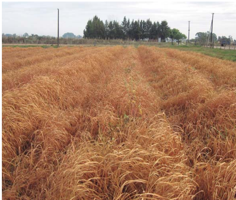
Figura 6. Abono verde quemado con herbicida sobre canteros.

En sistemas de laboreo reducido, los abonos verdes se instalarán sobre los canteros y se manejarán con cortes. Previo al trasplante se debe hacer un tratamiento del abono verde con herbicida (glifosato o glufosinato de amonio), con suficiente anticipación para evitar efectos alelopáticos (Figura 6).