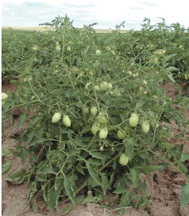
Figura 1. Planta de tomate para industria.

El tomate es una planta herbácea perenne pero cultivada como anual (Figura 1). El fruto es una baya de forma y tamaño variable dependiendo del número de lóculos.