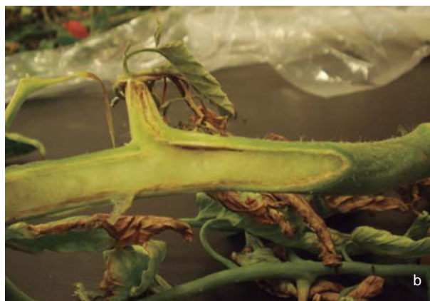
Figura 33. Síntomas de cancro bacteriano del tomate. a. Marchitamiento unilateral de hoja. b. Amarronamiento de los vasos.