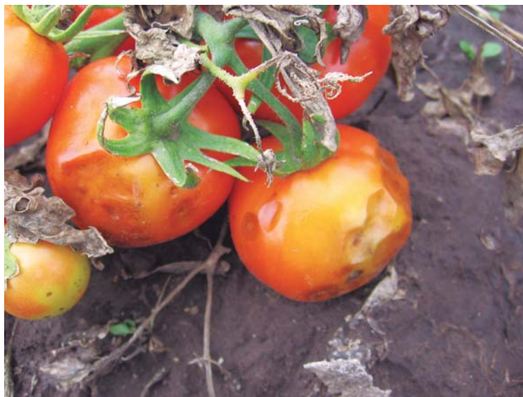
Figura 29. Síntomas de antracnosis en frutos.