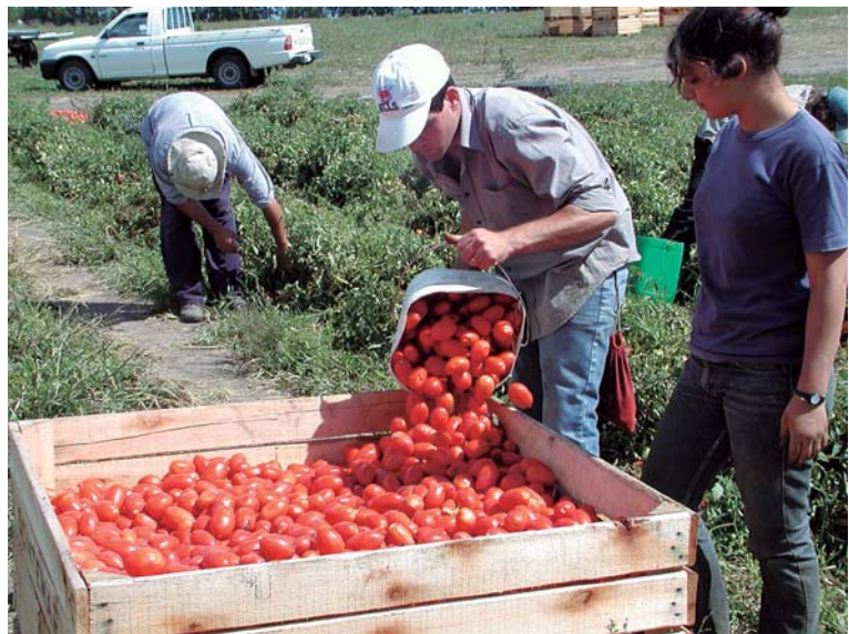
Figura 10. Cosecha del cultivo.