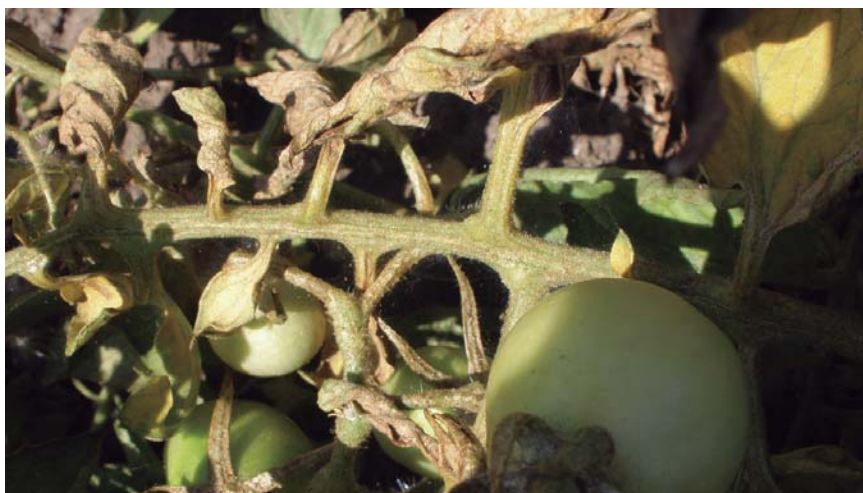
Figura 17. Daño de A. lycopersici sobre tallo y hojas de tomate.

El daño se manifiesta como un bronceado o herrumbre, primero en la base del tallo y luego en las hojas (Figura 17).