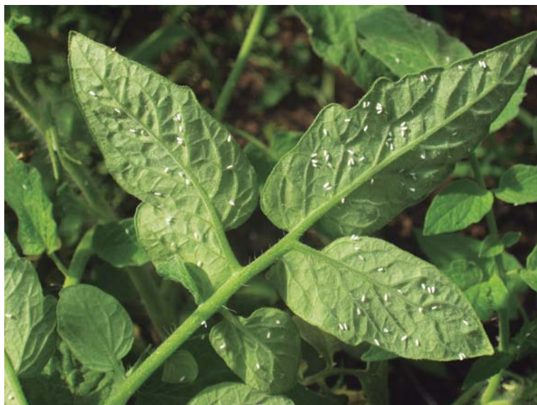
Figura 18. Adultos de mosca blanca T.vaporariorum sobre tomate.

El cultivo es perjudicado por las larvas y los adultos de la mosca blanca. Se alimentan de la epidermis sobre el lado inferior de las hojas succionando la savia. Debilitan las plantas, afectan negativamente su crecimiento y la producción.