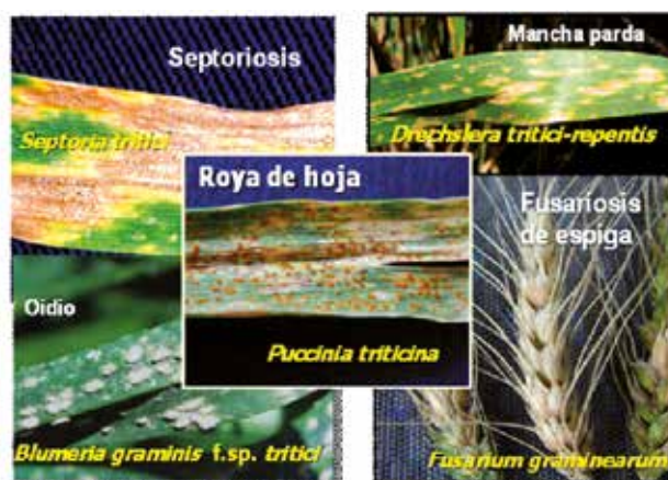
Figura 1 - Complejo de enfermedades en trigo.

Existe una relación significativa entre la precipitación efectiva acumulada en el PC y el rendimiento del cultivo (Figura 2). Los mayores rendimientos se obtuvieron con rangos de lluvias entre 30 y 120 mm. Con lluvias menores a 30 mm, el efecto negativo es directo. La escasez de agua afecta la absorción de nutrientes, el transporte